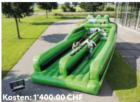
Kosten: 1'400.00 CHF