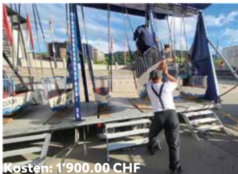
Kosten: 1'900.00 CHF