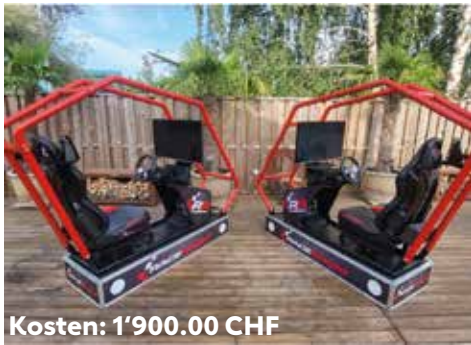
Kosten: 1'900.00 CHF